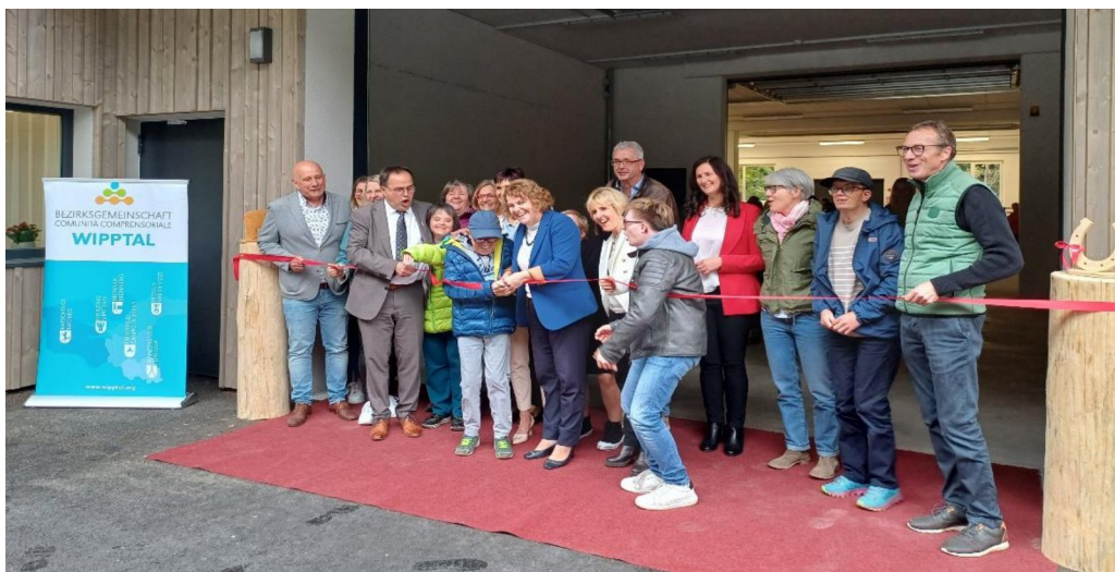
Cerimonia di inaugurazione delle nuove strutture nell'ottobre 2024