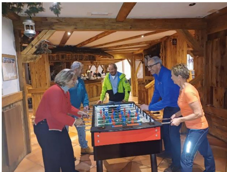
Escursione dei volontari del Servizio sociale a Ridanna partita di calcetto