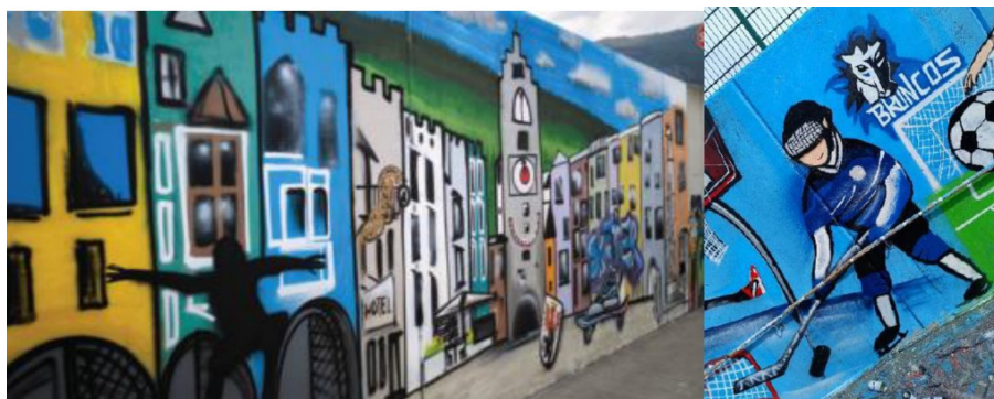
Graffiti al sottopassaggio del parcheggio "Klammer"

I laboratori di graffiti in autunno sono stati un completo successo. In 6 giorni di settembre e ottobre, 46 giovani hanno progettato parte del sottopassaggio di Vipiteno insieme all'artista di graffiti Paul Löwe. Con bombolette spray e idee creative, gli artisti entusiasti hanno evocato i monumenti della città, lo sport e il paesaggio sui muri.