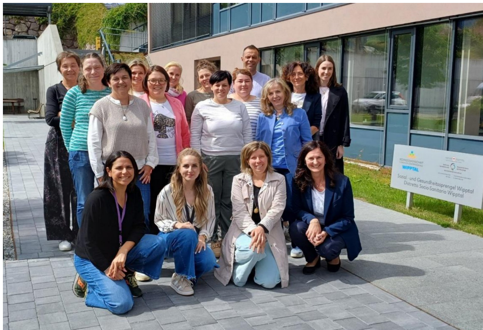
Team del Distretto sociale Wipptal

Tutti loro meritano un grande ringraziamento e apprezzamento per il loro lavoro professionale e competente, per l'impegno volontario e la partecipazione, per la condivisione delle responsabilità e per il loro impegno verso il benessere dei cittadini che usufruiscono della nostra consulenza, supporto, accompagnamento, assistenza, sostegno e cura.